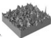
Image agrandie d'un verre de douche ordinaire, présentant des traces de corrosion suite à une utilisation quotidienne.

Le verre ordinaire perd son aspect brillant dès les premiers contacts avec l'eau. Malgré un nettoyage régulier, le verre de douche perd de sa brillance au fil du temps. Eau calcaire, humidité et savon laissent des traces sur la surface du verre. Saleté et résidus altèrent progressivement et irrémédiablement la beauté de votre paroi de douche.